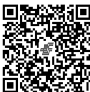
扫码订阅 《临床耳鼻咽喉头颈外科杂志》